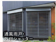
通風雨戸・ 外付シャッター