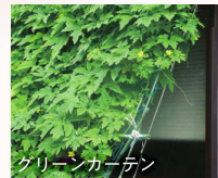
グリーンカーテン